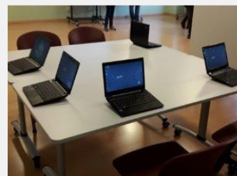
Aule interattive innovativi